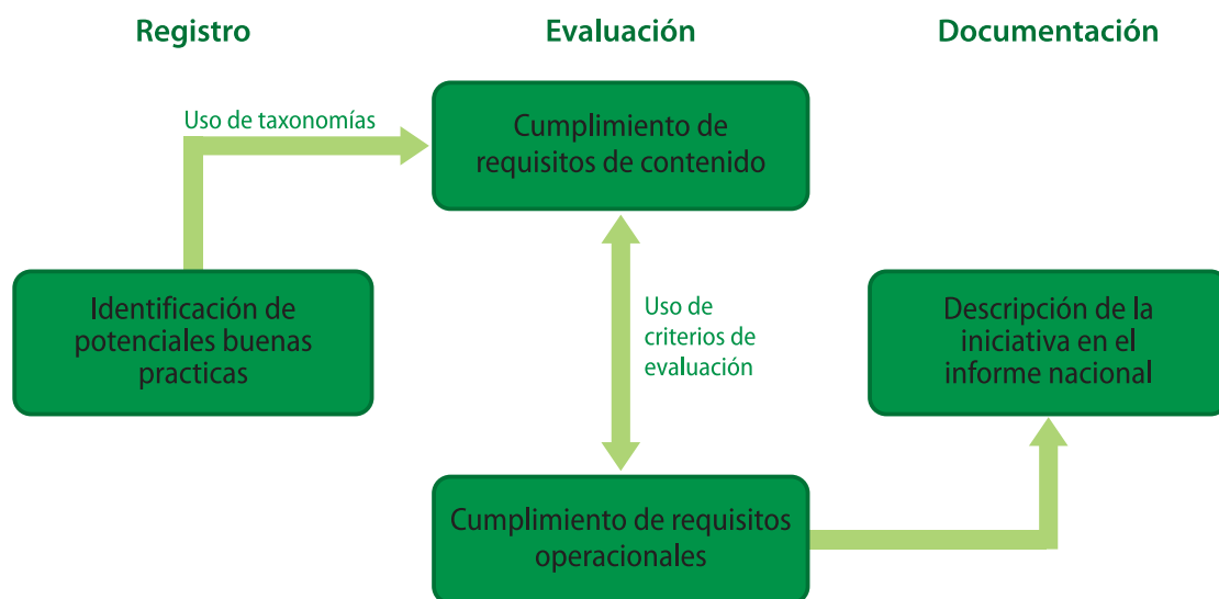
Diagrama 4 Etapas de identificación y análisis de buenas prácticas

Esta fase está compuesta de tres etapas: el registro, la evaluación y la documentación (véase el diagrama 4).