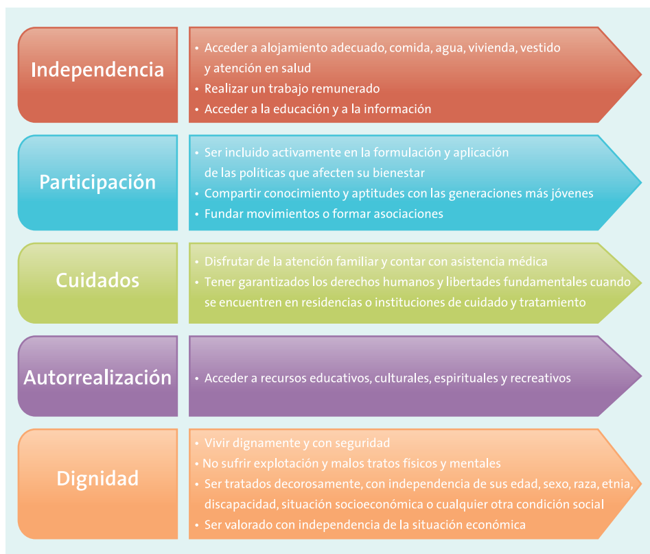
Diagrama 1 PRINCIPIOS DE LAS NACIONES UNIDAS A FAVOR DE LAS PERSONAS DE EDAD Y ASPECTOS IMPLICADOS

Fuente: Elaborado sobre la base de Naciones Unidas, Resolución 46/91. “Ejecución del Plan de Acción Internacional sobre el Envejecimiento y actividades conexas”, 16 de diciembre de 1991.