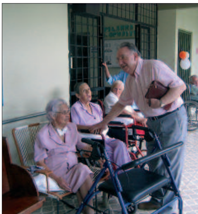
Visita al Hogar de Ancianos Valverde Vega, en Sarchí. FP

El presidente de FIAPAM recorrió las dependencias de ambos centros y escuchó las explicaciones de su funcionamiento por parte de los responsables de estas instituciones, así como la forma de financiación y sus proyectos de futuro. En palabras de Chato, dos magníficas realizaciones donde, con verdadero cariño y amor, atienden a los mayores más necesitados y los proporcionan unos años de vida confortables, llenos de atención y amor.