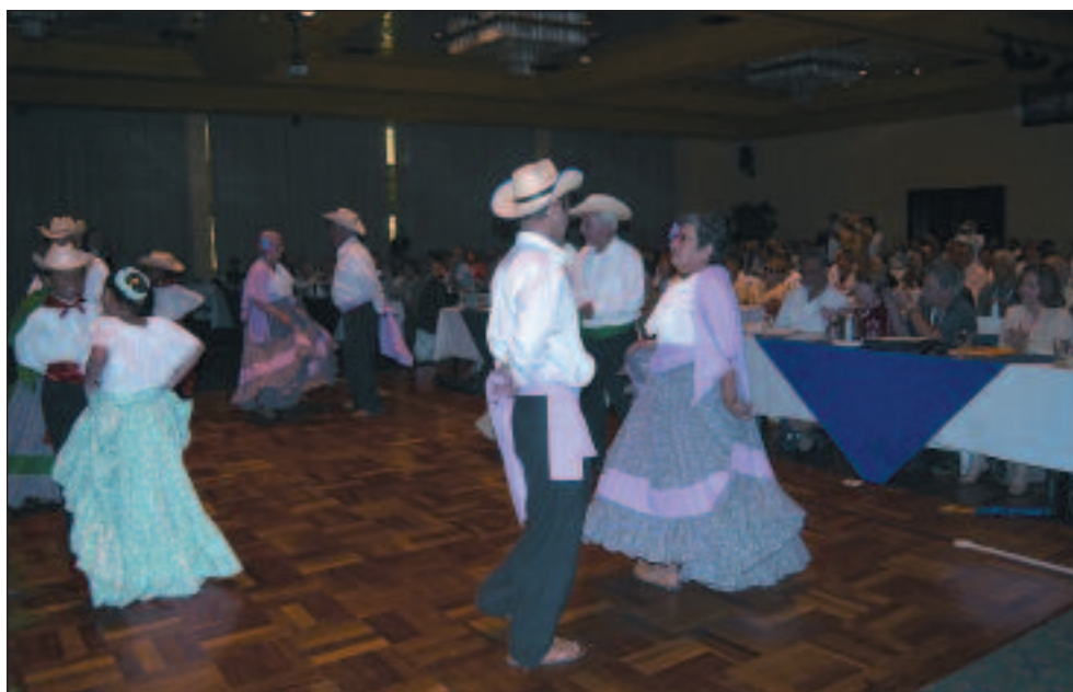
El folclore de Costa Rica estuvo presente en la sesión inaugural.